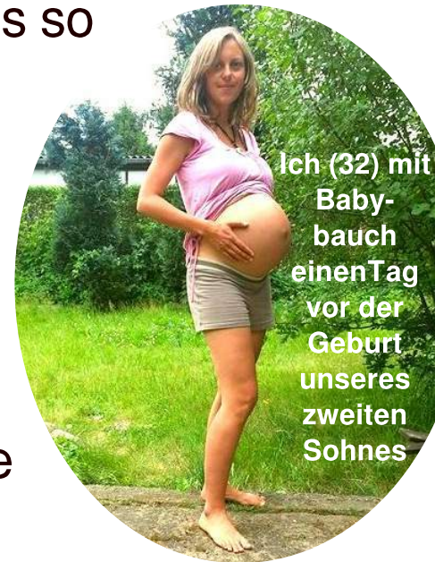
Ich (32) mit Babybauch einen Tag vor der Geburt unseres zweiten Sohnes